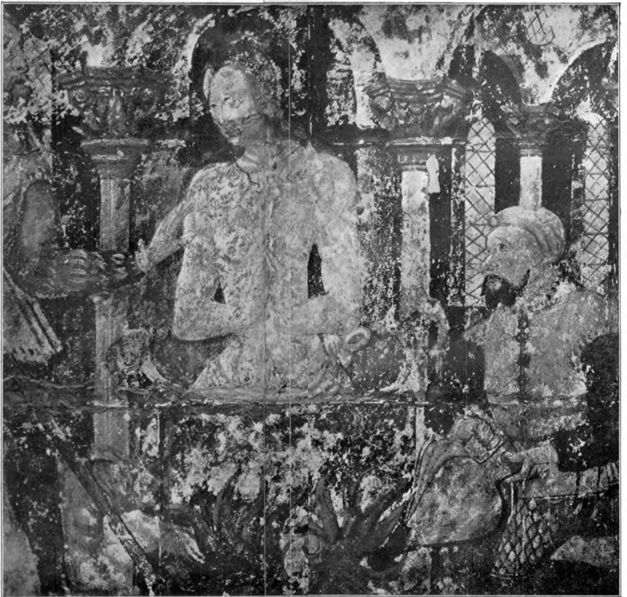
PEINTURE MURALE DE SAINTE JULIENDANS L'ÉGLISE NOTRE-DAME D'ÉTAMPES.